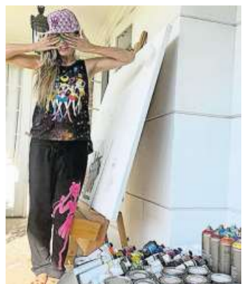
Heidi Klums liebstes Accessoire ist neu ein Pinsel.